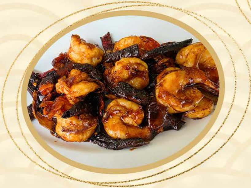
1301 宫保虾球 Prawn with Dry Chilli