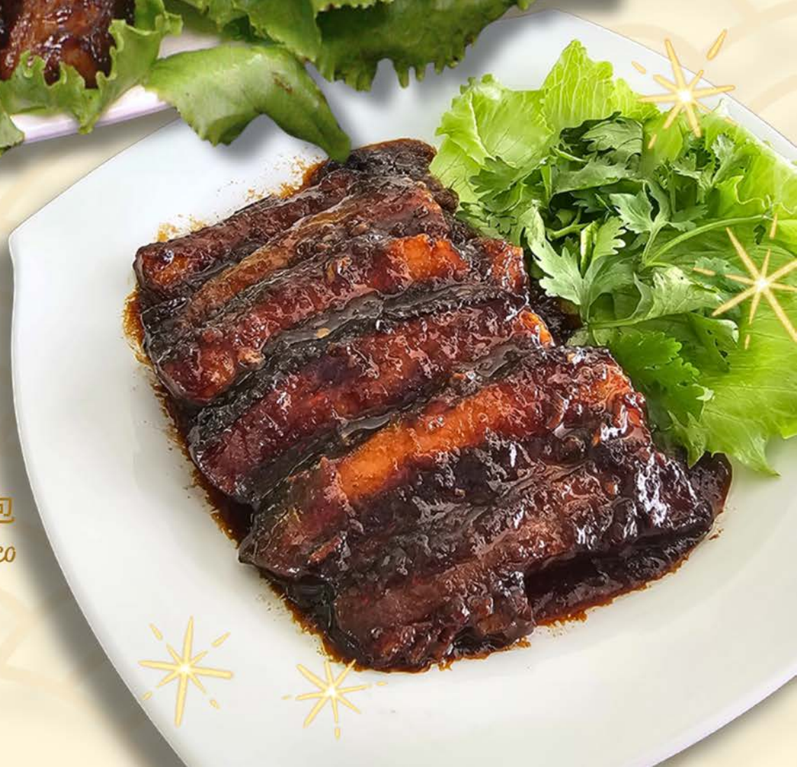
3001 西班牙黑猪扣肉包 Braised Spanish Iberico Pork with Pau