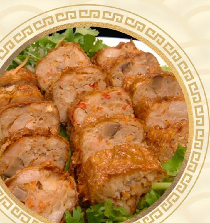
1281 西施虾卷 Prawn Roll