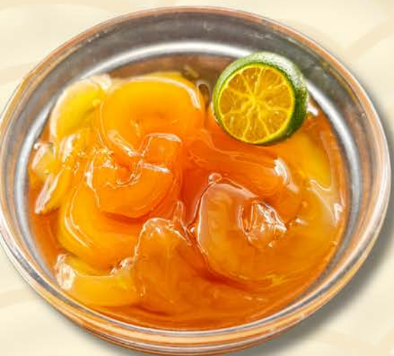
9050 海底椰 Sea Coconut $2.50