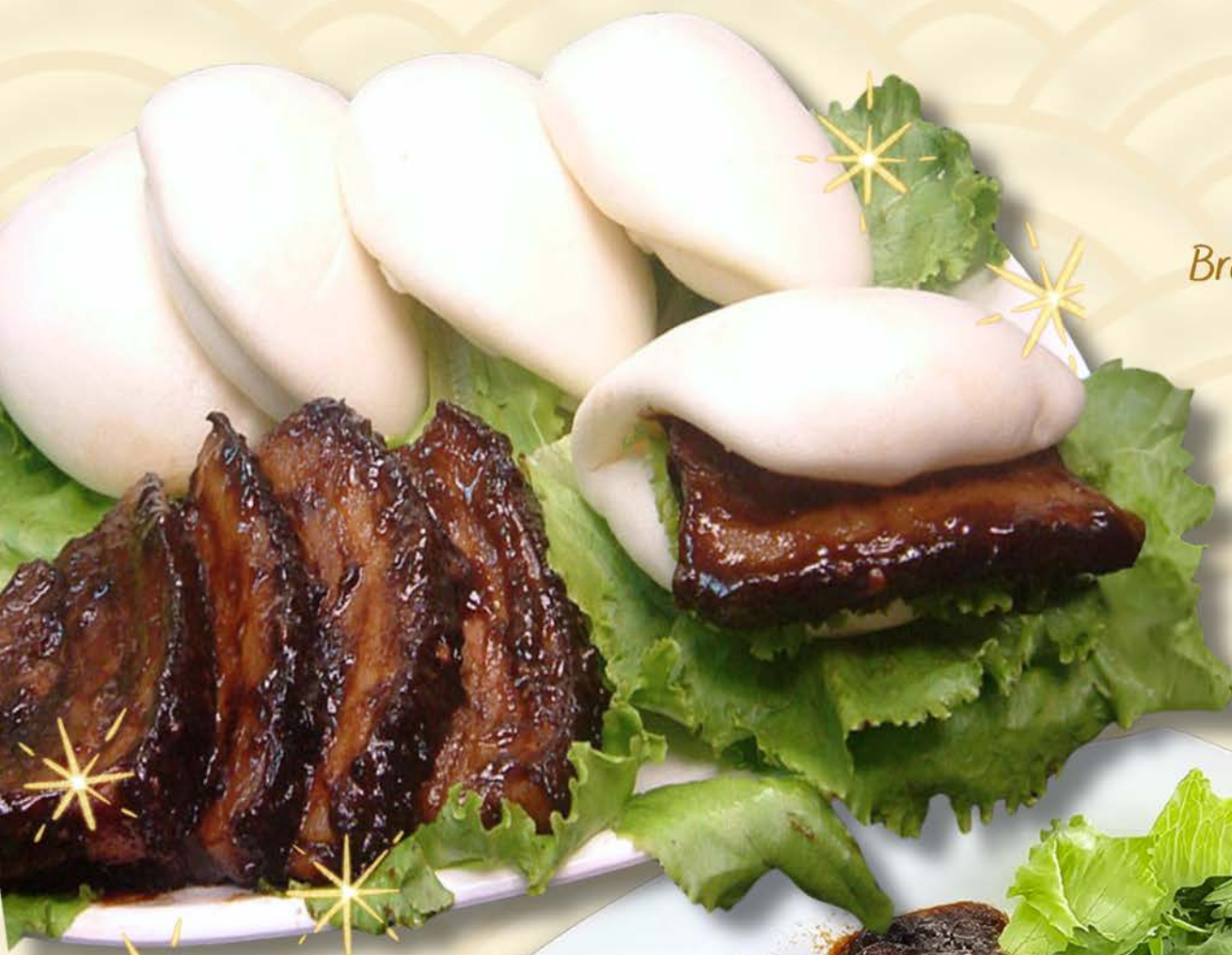
3011 扣肉包 Braised Pork with Pau