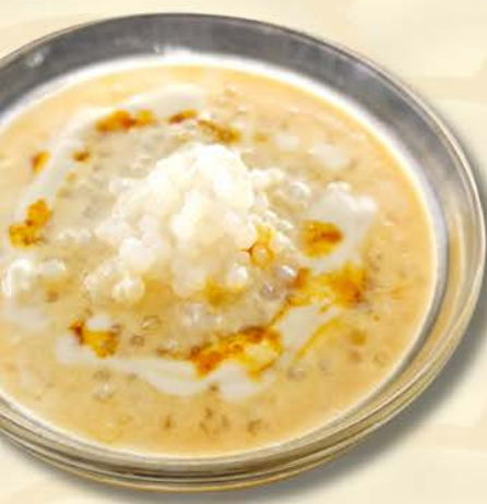
9010 椰糖西米露 Gula Melaka with Sago $2.50