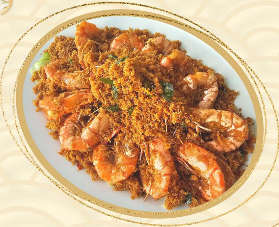
1221 奶油大虾 Butter King Prawn