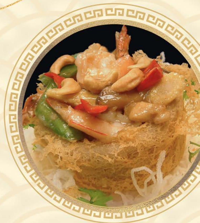
1271 砵钵飘香 Yam Basket