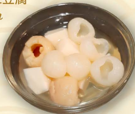
9030 龙眼荔枝杏仁豆腐 Almond Jelly with Longan & Lychee $2.50