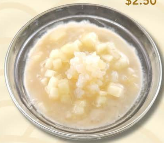
9020 蜜瓜西米露 Honeydew with Sago $2.50