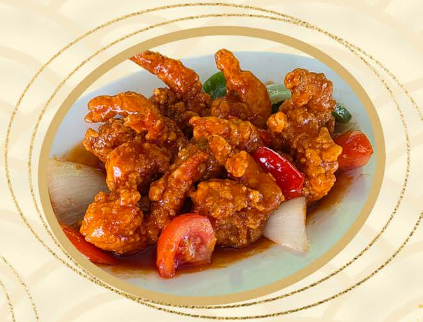
1291 咕嚕虾球 Sweet & Sour Prawn